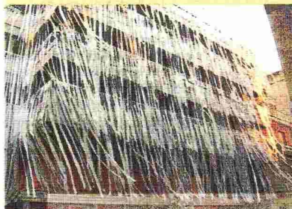
Έργο του Ιταλού αρχιτέκτονα Gianni Pettena για την απότομη αστικοποίηση της Αθήνας

Τα νωπά αποτελέσματα της μεταστροφής του Ψυρρή αποκλειστικά στην αναψυχή είναι χαρακτηριστικό παράδειγμα προς αποφυγή. «Η μονοειτουργικότητα σημαίνει το τέλος της πόλης. Στην περιοχή του Ψυρρή είχαμε τη μεγαλύτερη και πιο σιωπηλή εκδίωξη χειροτεχνιών και βιοτεχνιών στην ιστορία της Αθήνας. Αντιστοίχως, η μεταβολή του χαρακτήρα της Ιεράς Οδού σε διασκεδαστήριο είναι ισοπεδωτική», σημειώνει ο καθηγητής Αρχιτεκτονικής, Συνεπώς, στην περίπτωση Κεραμεικού - Μεταξουργείου «πρέπει να ανοικτεί όλη η βεντάλια δραστηριοτήτων μιας πόλης, με καταστήματα ή γραφεία στο ισόγειο και κατοικίες στους ορόφους». Μοντέλο που εγγυάται το ζωντανά της γειτονιάς και όχι -όπως επισημαίνει ο Θωμάς Δοξιάδης- τη «μουσειακή διατήρησή της».